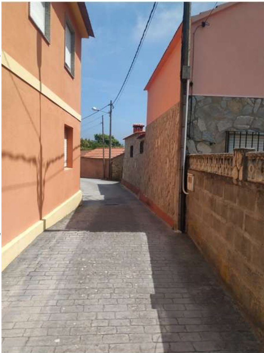
Camiño Vello a Nigrán

Un Camiño Vello se encuentra en Nigrán, sale de la Avenida do Val Miñor y acaba en la Rúa dos Pazos, con un enlace que lleva de nuevo a la Avenida do Val Miñor. En esta calle hay alguna que otra casa centenaria, pero la mayoría de las edificaciones se construyeron a partir de la década de 1960, e incluso se construyeron varios edificios.