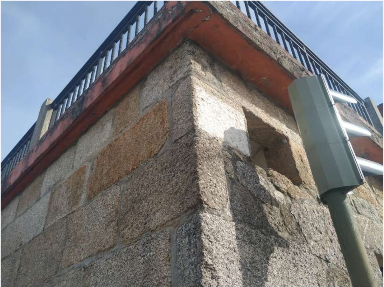
Lugar donde estaba la placa de la Rúa de Nandín