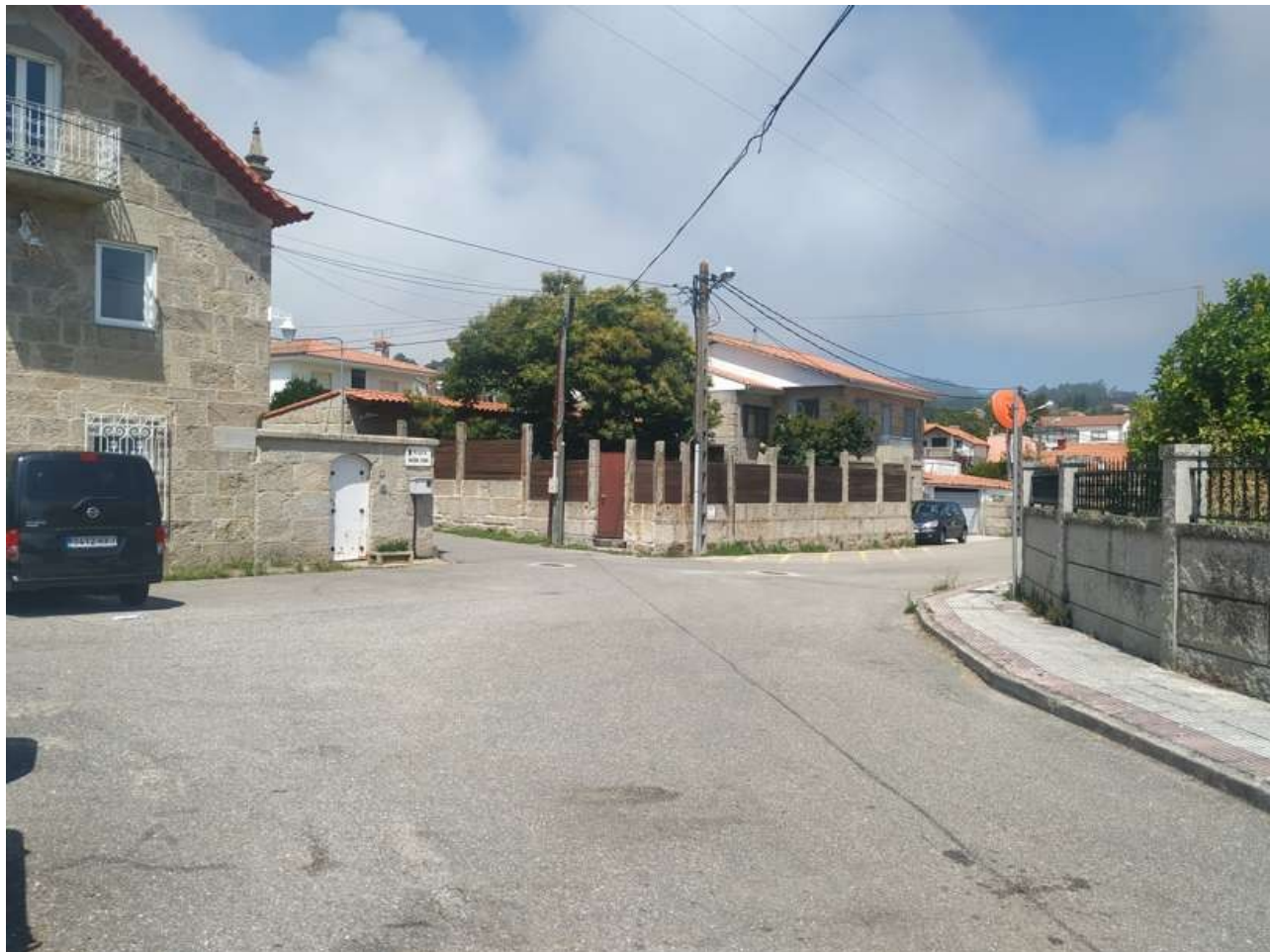
Praza da Mestra Doña Elvira