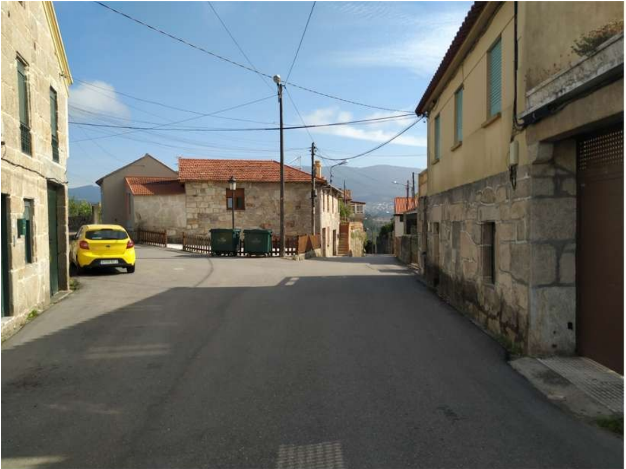
Praza de Joaquín Iglesias Portela