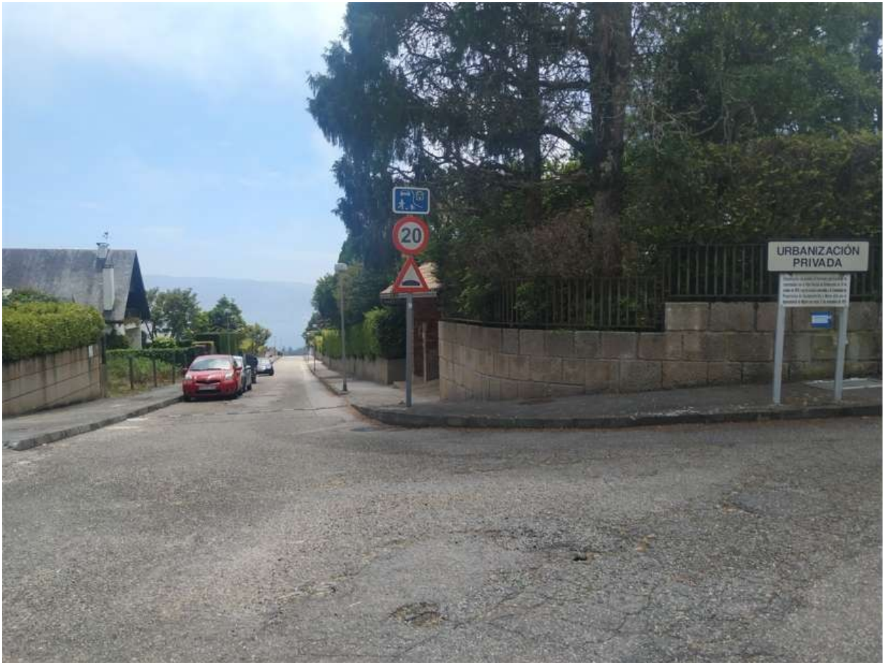
Rúa do Freixo, en el cruce con la Rúa da Laranxeira