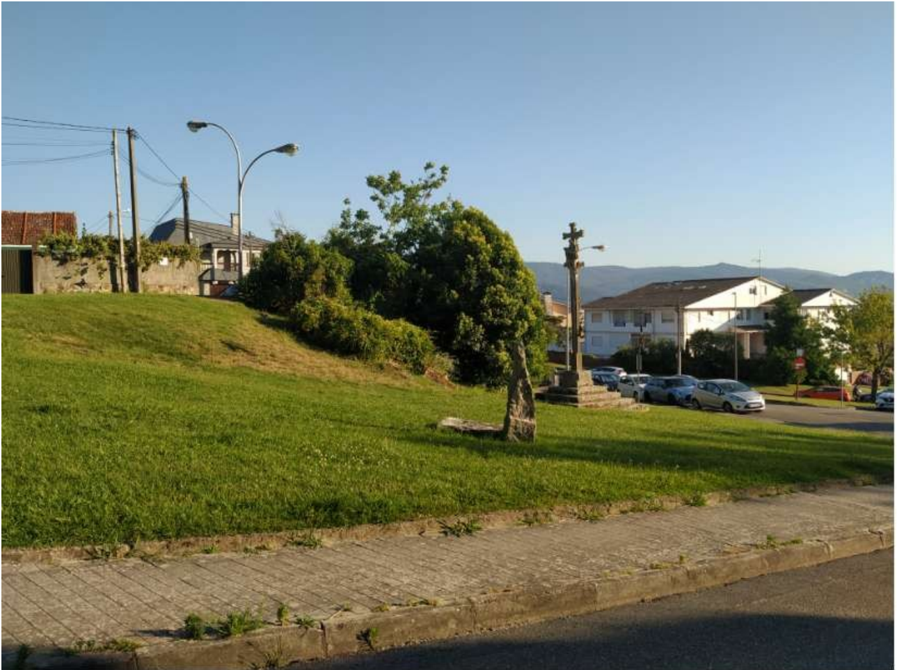
Praza do Cruceiro