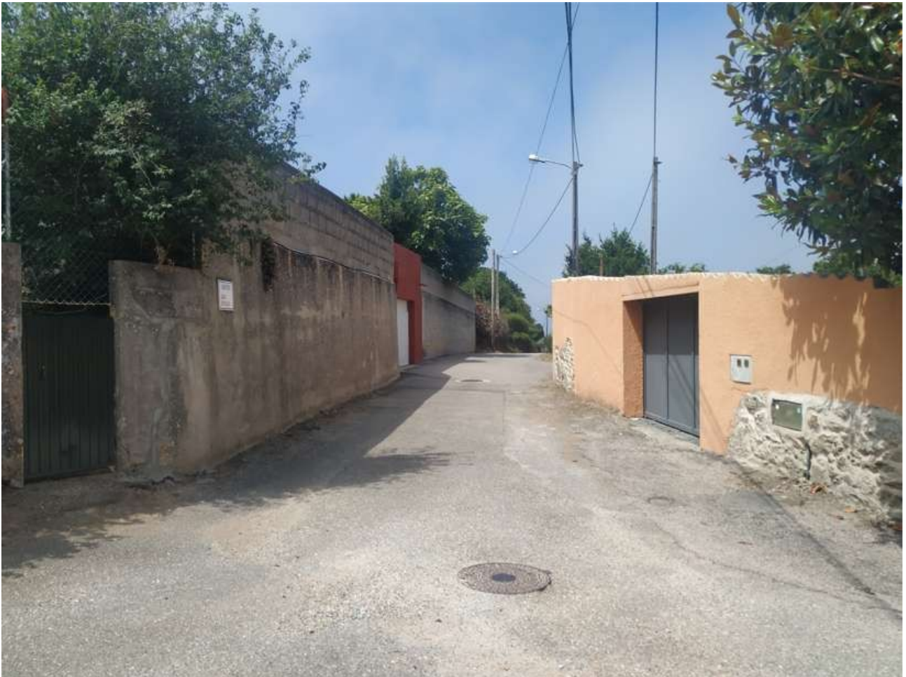
Camiño das Buxías

Puede referirse a una zona donde existieran manzanos que dieran mazás buxías , o referirse a las velas de cera, ya sea en sentido figurado o por encontrarse en este lugar una fábrica. O incluso puede referirse al apodo de uno de los antiguos propietarios del lugar.