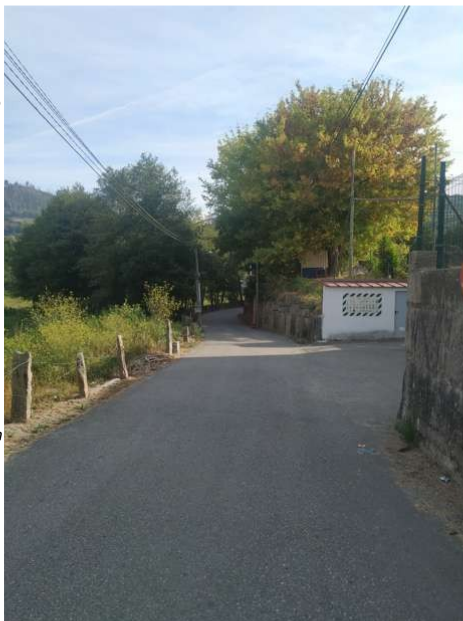
Rúa das Milisozas

ubicado junto a la AG-57 y lindante con Camos, Parada, Vilaza y Vincios.