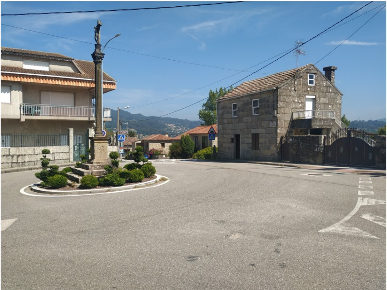
Praza de Castelao