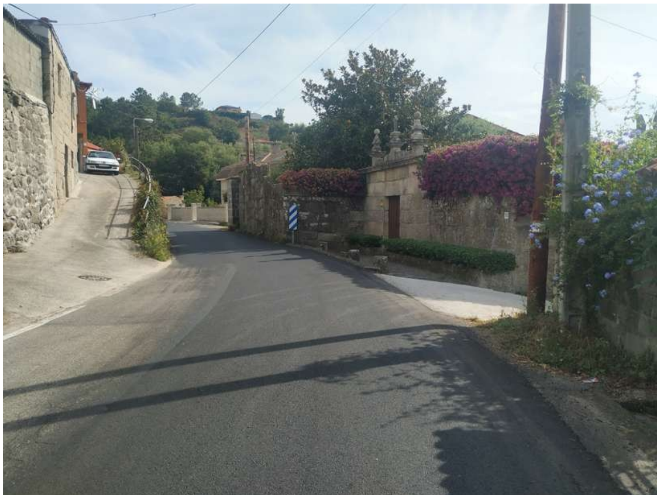
Rúa das Baleazas

Este topónimo es bastante oscuro, parece ser un aumentativo de balea , este nombre, aunque lo parezca no designa solo a las ballenas, también a los animales más grandes de lo normal, en sentido bondadoso. Así que este topónimo se puede aplicar en sentido figurado, haciendo referencia o algún animal muy grande que rondaría la zona o incluso más probable a las propias tierras, de gran tamaño respecto a otras o de gran productividad.