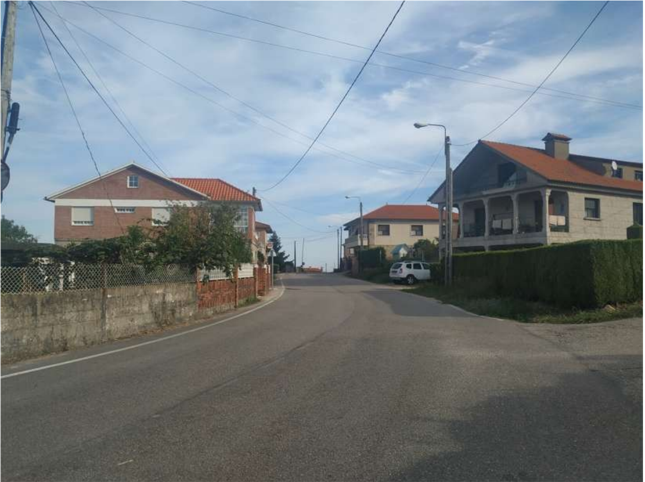
Rúa de Chandebrito, en su parte central