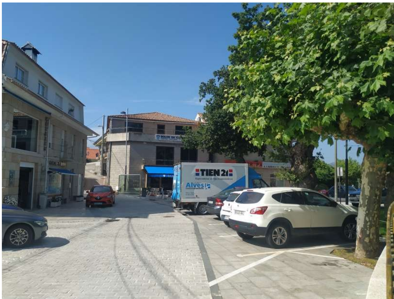
Praza da Carrasca

Cualquiera de los dos significados pudo dar lugar al topónimo (en el primer caso se trataría de un topónimo en sentido figurado y en el segundo haría referencia a la abundancia de este insecto en estas tierras, pero incluso es posible que no se trate de nada de eso y haga referencia a otra cosa, incluso a un apodo de un antiguo propietario (A Carousa → A do Carouso ), así que nada se puede decir con certeza.