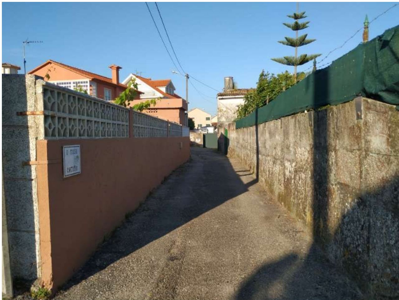
Camino conocido como O Noso Camiño

A este camino sin salida y que nace en la Rúa da Area Alta, en Panxón, se le conoce como O Noso Camiño . El nombre no deja de ser curioso, dado que haría referencia a un camino privado perteneciente a varios vecinos, pero con una especie de halo de comunidad, para diferenciarlo de los demás caminos. Desconozco la historia que se oculta tras este camino (a día de hoy es accesible para todo el mundo y en él hay varias casas), y para mantener la estructura normal de Camiño + de + (nombre) se oficializó como Camiño O Noso , manteniendo el nombre original en la placa.