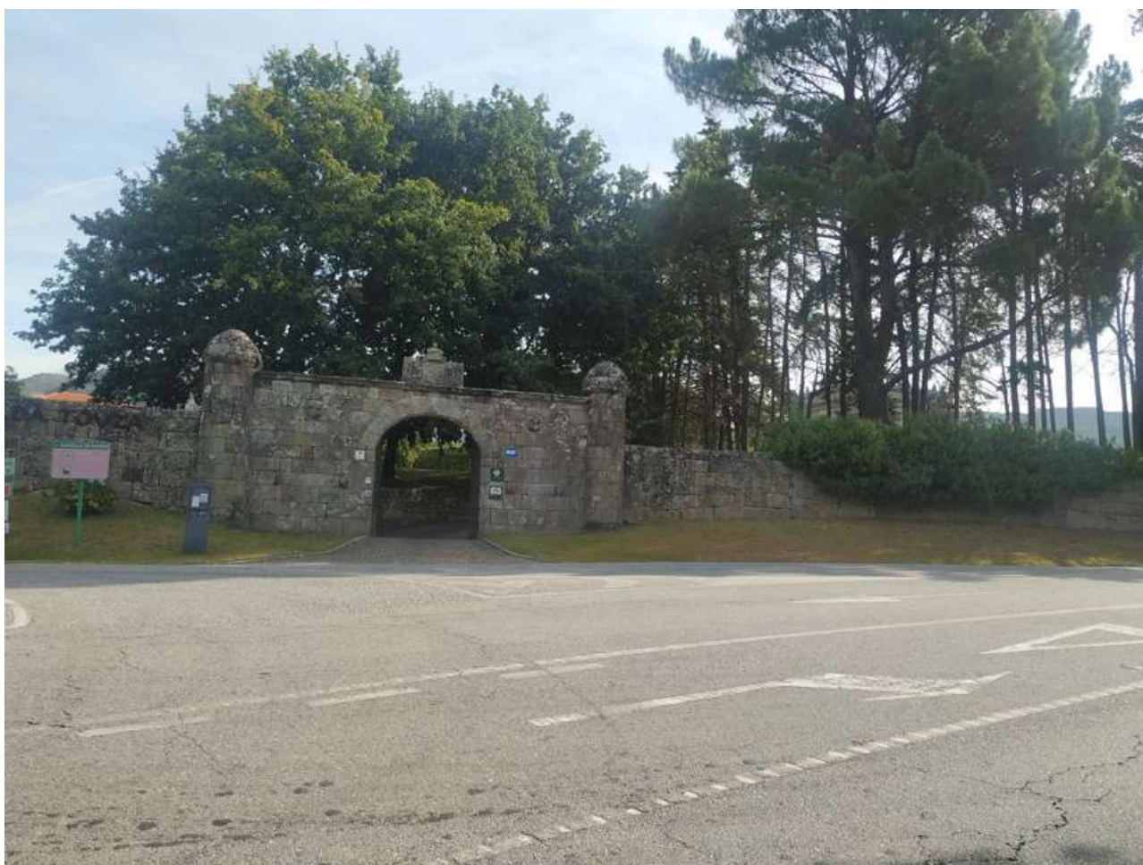
Pazo da Touza

El término paxoleiro se utiliza para designar a personas simples, papanatas y bobariconas. Puede referirse al apodo de un antiguo propietario de los terrenos, o tratarse de un topónimo en sentido metafórico, referido a los terrenos.