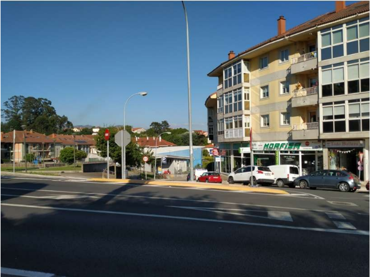
Rúa dos Argonautas