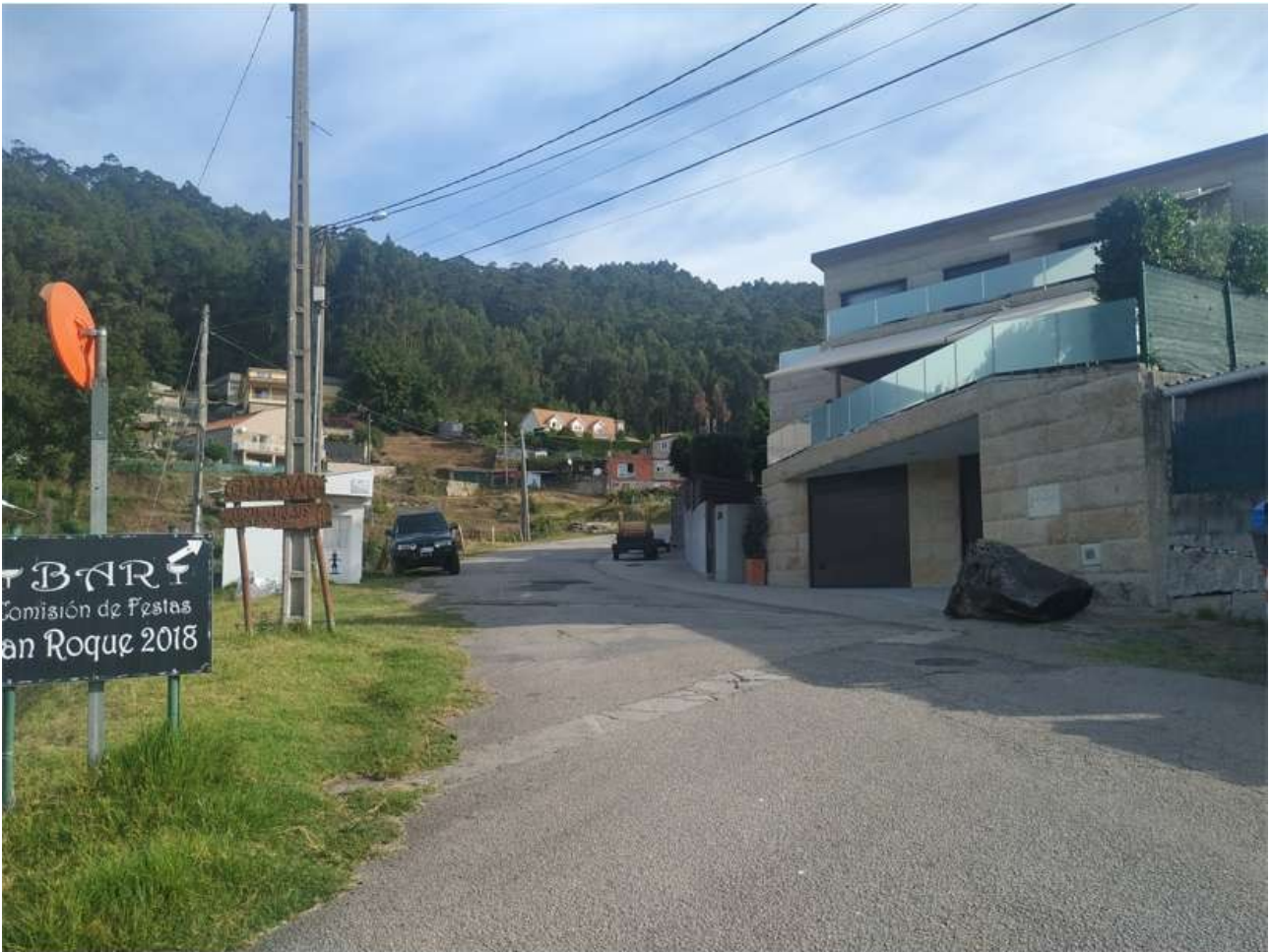
Rúa das Barreiras