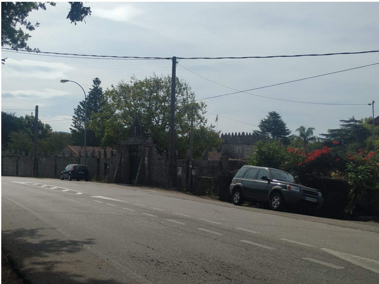
Pazo de Urzáiz

En el caso del Camiño do Pazo de Nigrán el pazo del que tomaría el nombre parece que ya no existe y solo queda su huella en la toponimia, aunque puede referirse a un paso, es decir, a unas piedras colocadas para atravesar un río, dado que los topónimos O Pazo y O Paso son indistinguibles en el habla debido al seseo.