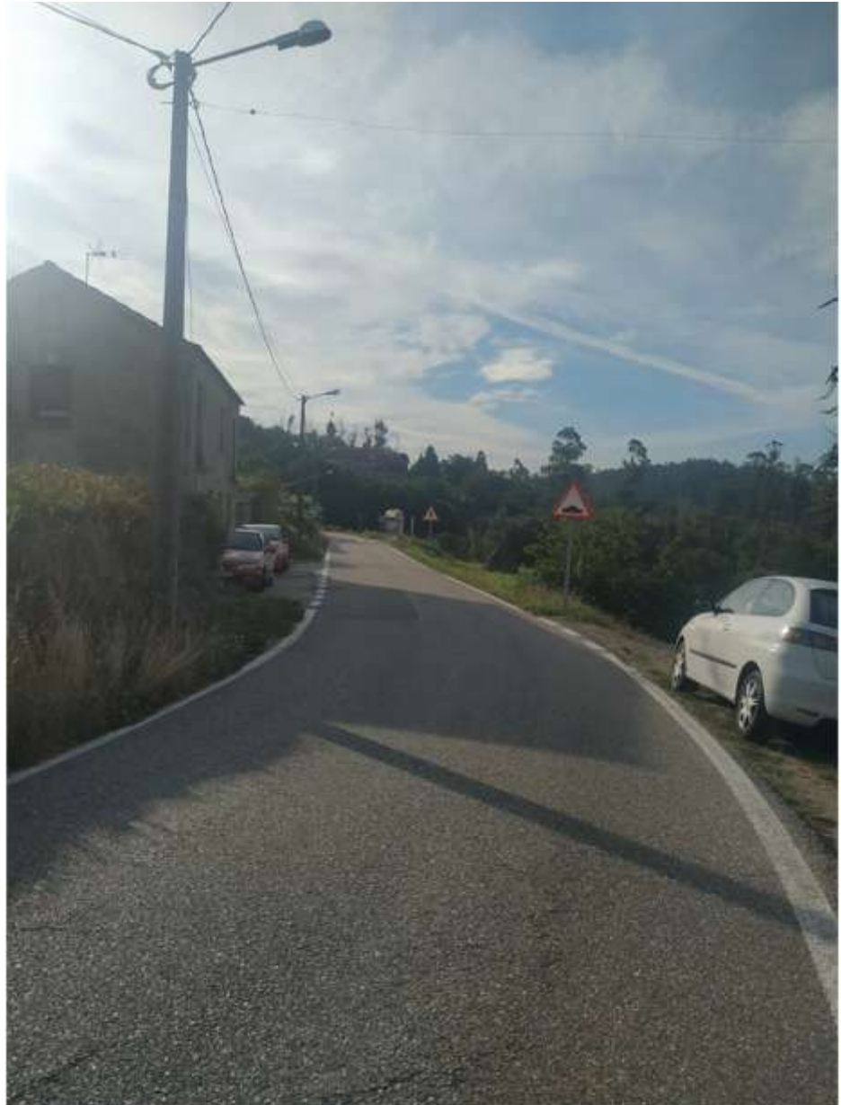
Rúa de Pracíns

Esta calle se encuentra en Chandebrito, sale de la parroquia de Camos, conociéndose en este lugar como Rúa das Fontes y atraviesa el barrio de Pracíns para acabar en la parroquia de Vincios, ayuntamiento de Gondomar, en la aldea conocida como O Salgueiro (aunque la carretera se conoce como Estrada do