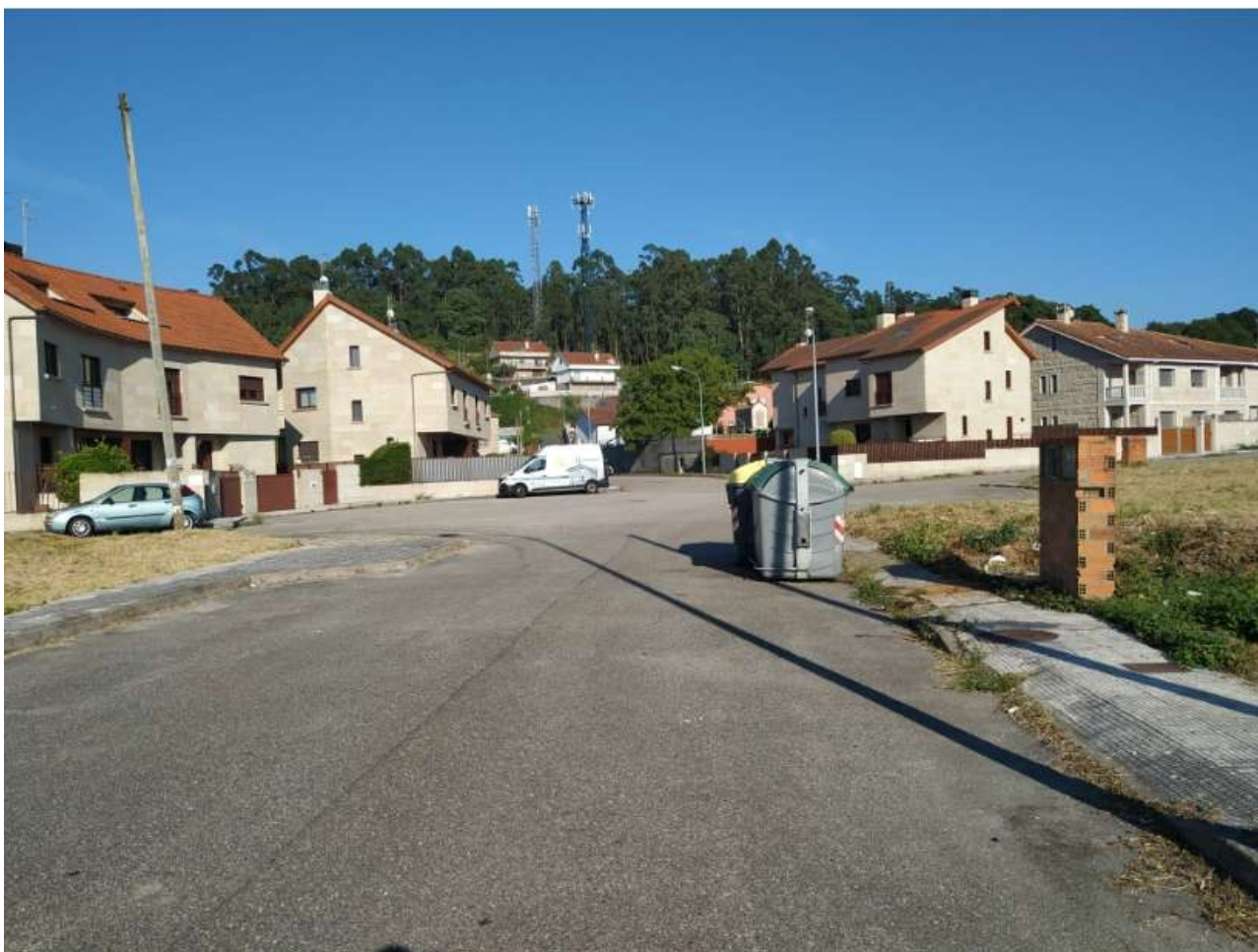
Rúa do Monte Castelo

Haría referencia a un monte ubicado en un lugar más alto que las tierras que lo rodean.