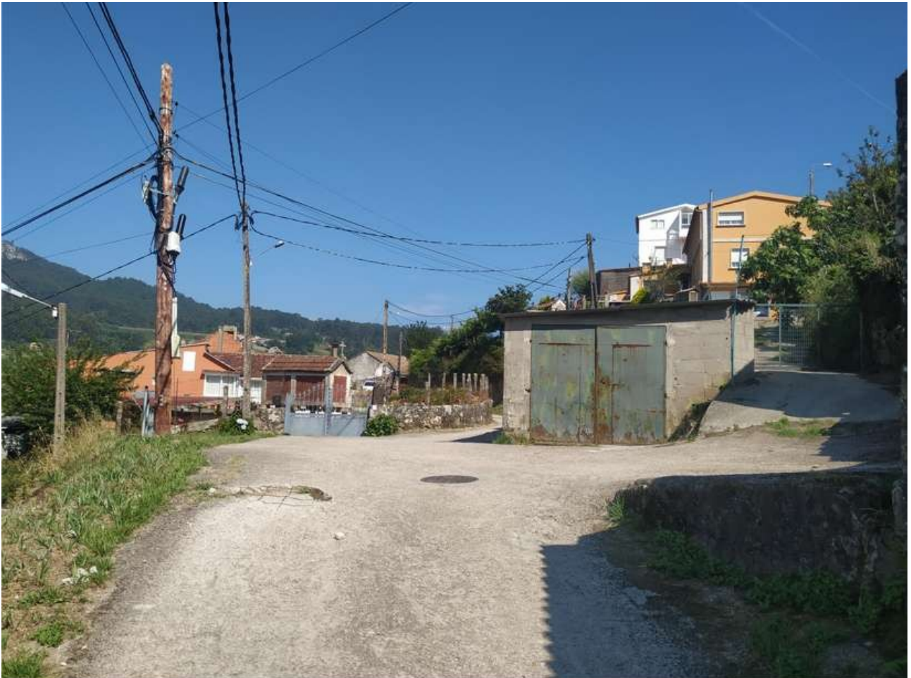
Camiño da Igrexa, en Parada

Seguramente haga referencia al apodo de un antiguo propietario de los terrenos, dado que esta palabra es muy recurrente para apodos que acaban callando en topónimos.