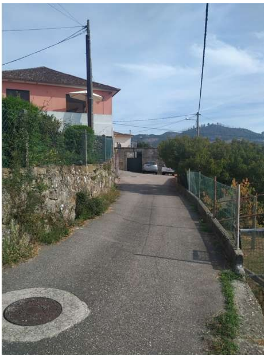
Rúa da Avoa Carmela, al fondo, la casa donde vivió

Esta calle se encuentra en Panxón, sale de la Rúa do Arquitecto Palacios y lleva a la Praza do Cruceiro. En esta calle se encuentra el centro de salud de Panxón, y un conjunto de casas y chalets construidos a partir de la década de 1960. Recibió el nombre en 1978.