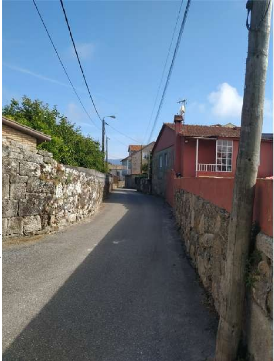
Rúa da Menora

empresa se creó en el año 1959 y permaneció activa hasta el año 2015, en el que presentó concurso de acreedores. Entre 1995 y 2008 se hacía una prueba de atletismo con su nombre. 31