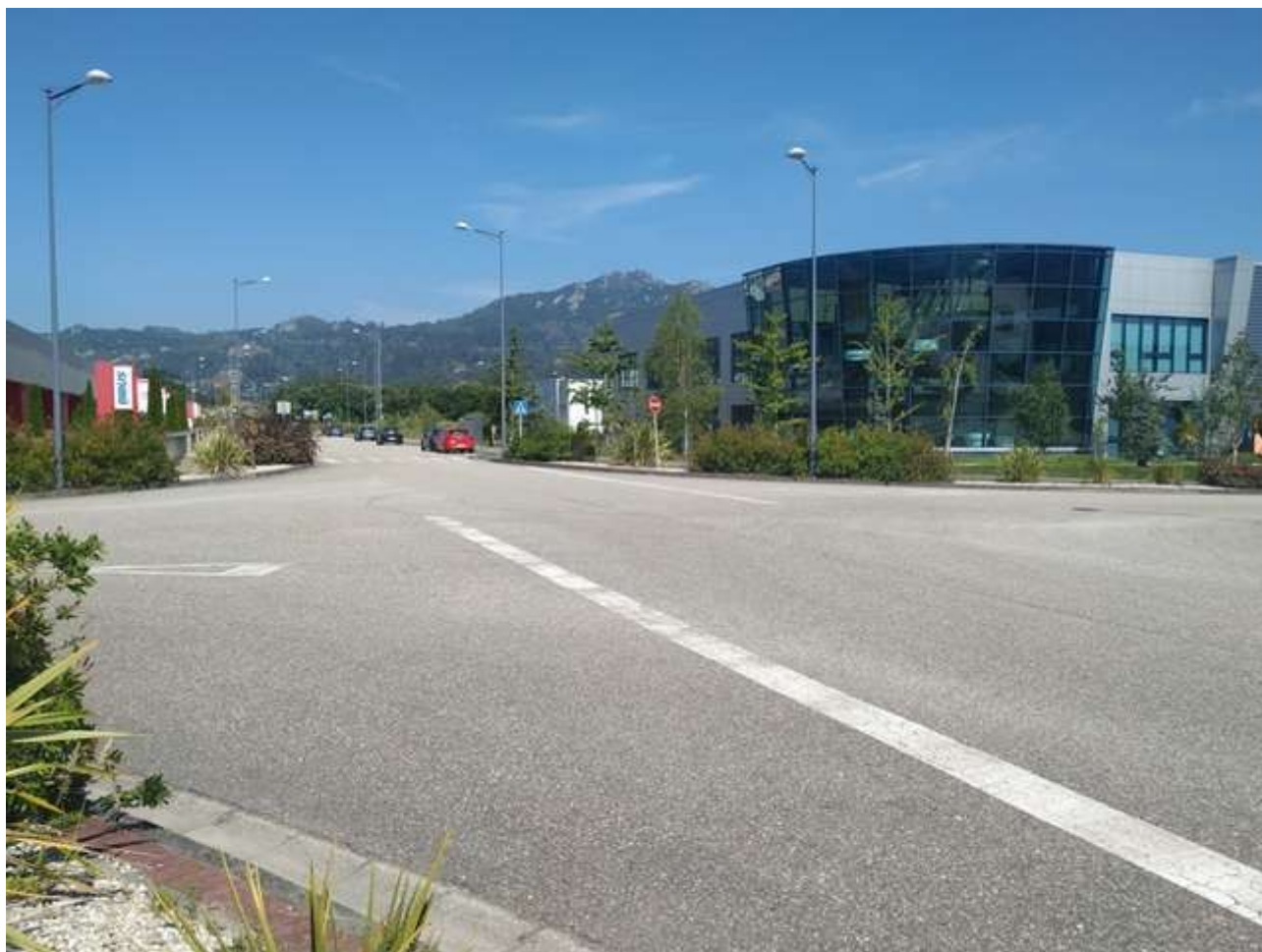
Rúa dos Padróns, en el cruce con la Rúa do Aroncal

Hace referencia a una zona pedregosa, deriva de pedra .