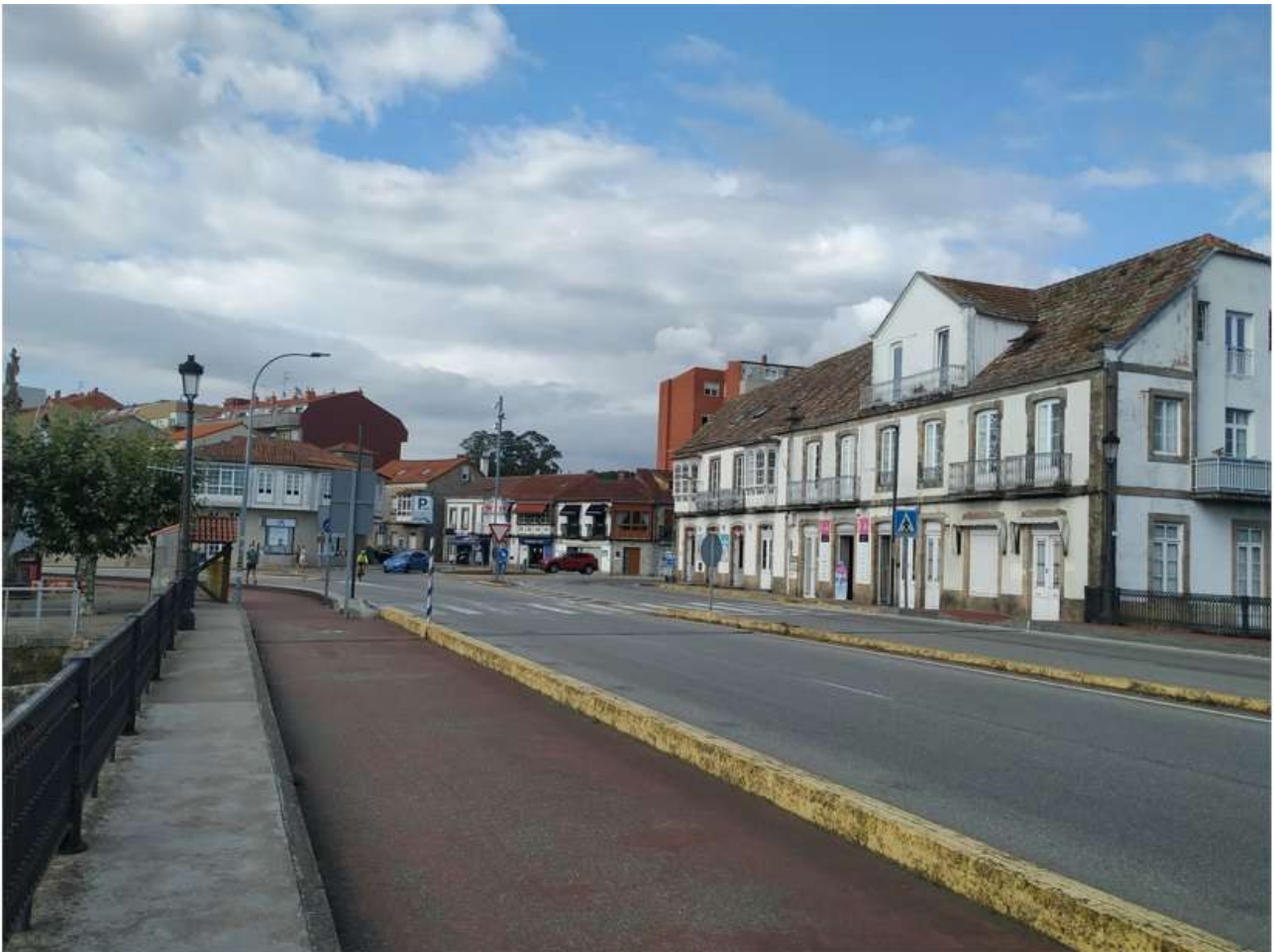
Rúa de Manuel Lemos, justo en el puente sobre el Río Miñor que separa Nigrán de Baiona

Dedicada a la capital de Argentina, Buenos Aires, a la que muchos gallegos emigraron entre finales del siglo XIX y principios del siglo XX, en busca de una mejor fortuna.