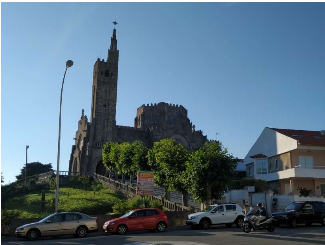
Templo Votivo del Mar