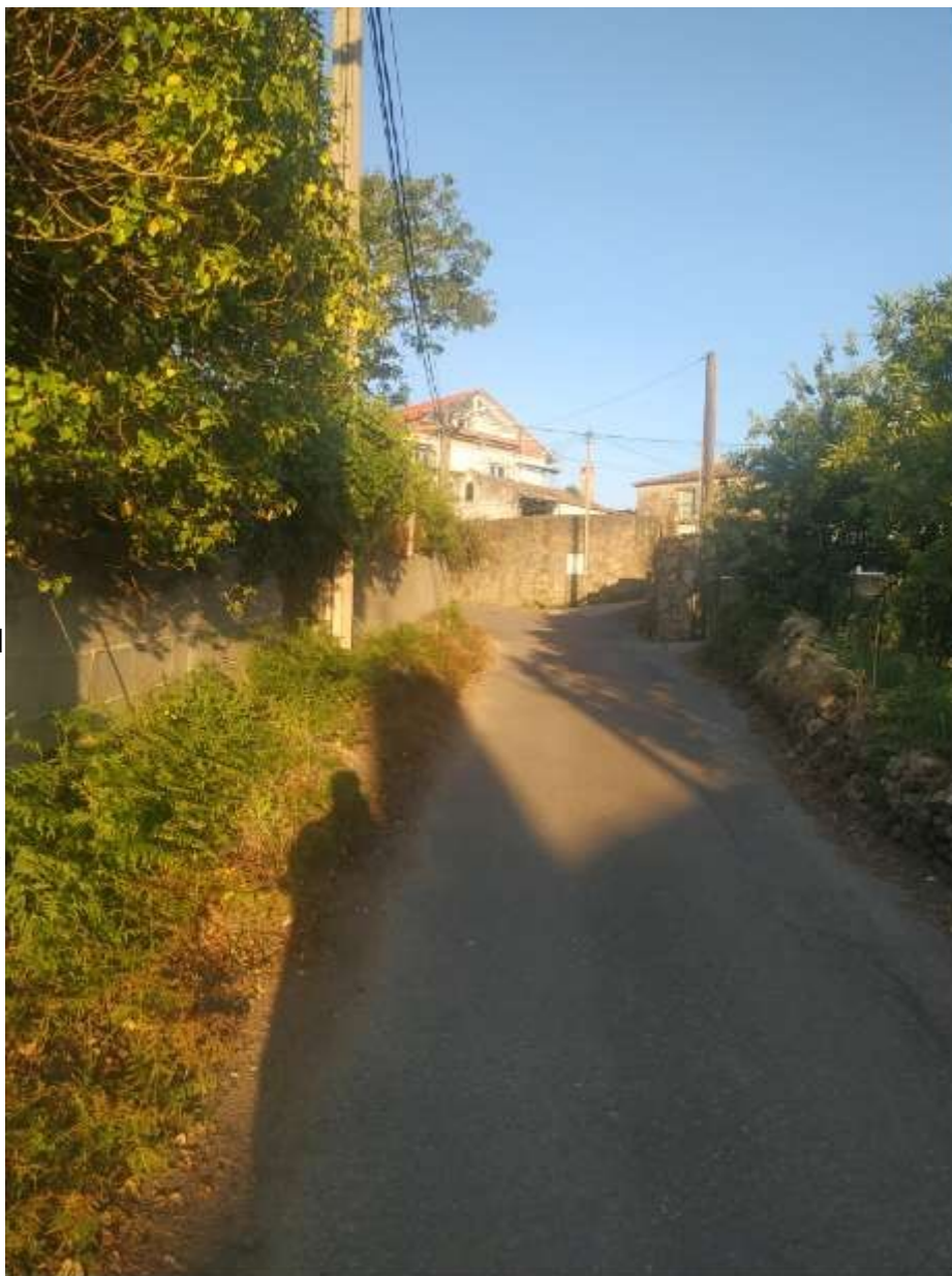
Rúa de Alborés Grande

convertido primero en Alvor y luego en Albor , este topónimo vendría de Villam Alvari , es decir, las tierras de Alvarus (este nombre sobrevive hoy en día como Álvaro).