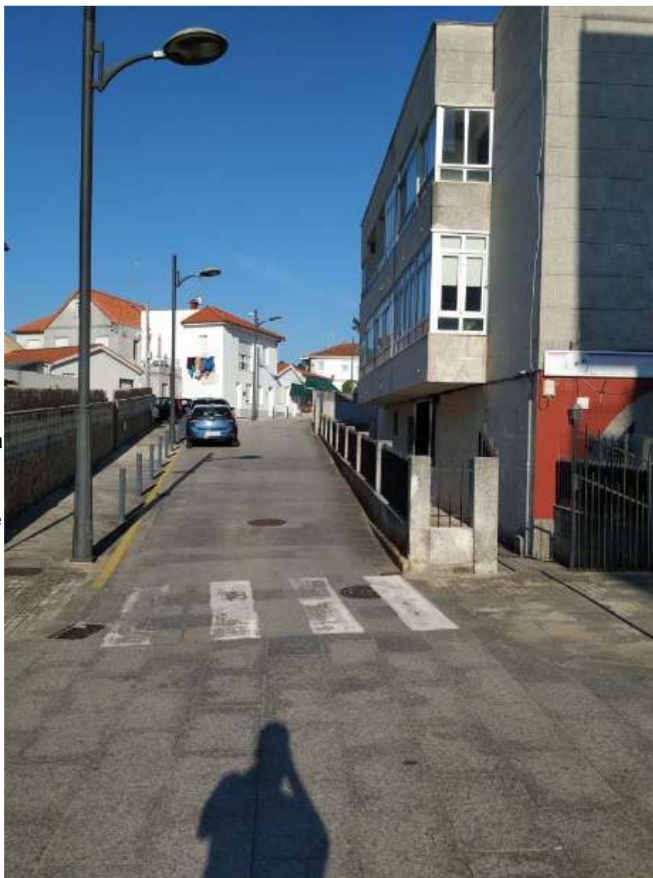
Rúa da Concordia

edificada a partir de la década de 1970, con varios edificios.