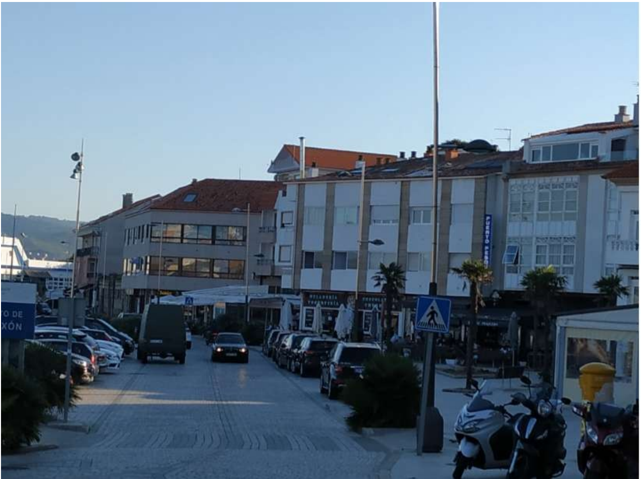
Praza de José Mogimes