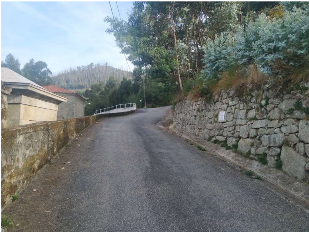
Subida ó Monte Castelo

El único monte así conocido por la zona se encuentra en Tomiño, en la parroquia de Amorín, así que esta calle estaría dedicada a dicho monte.