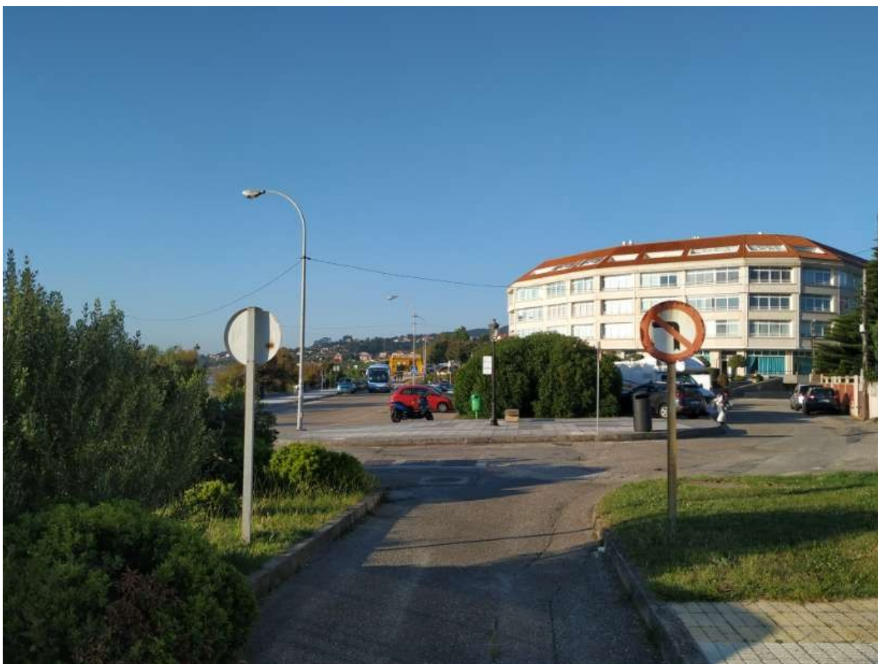
Praza de Mario Puentes