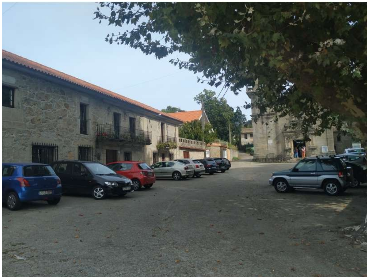
Camiño das Angustias

Esta calle se encuentra en Nigrán, sale de la Rúa dos Pazos y la Avenida do Val Miñor. En ella se encuentra la capilla de Nuestra Señora de las Angustias, de la que toma el nombre, capilla que no pocas personas confunden con la iglesia parroquial de Nigrán, iglesia que se encuentra al este de la parroquia, aunque esta capilla a veces funcione como tal. La capilla es del siglo XVIII, y las casas de la calle se construyeron a partir de la década de 1930.