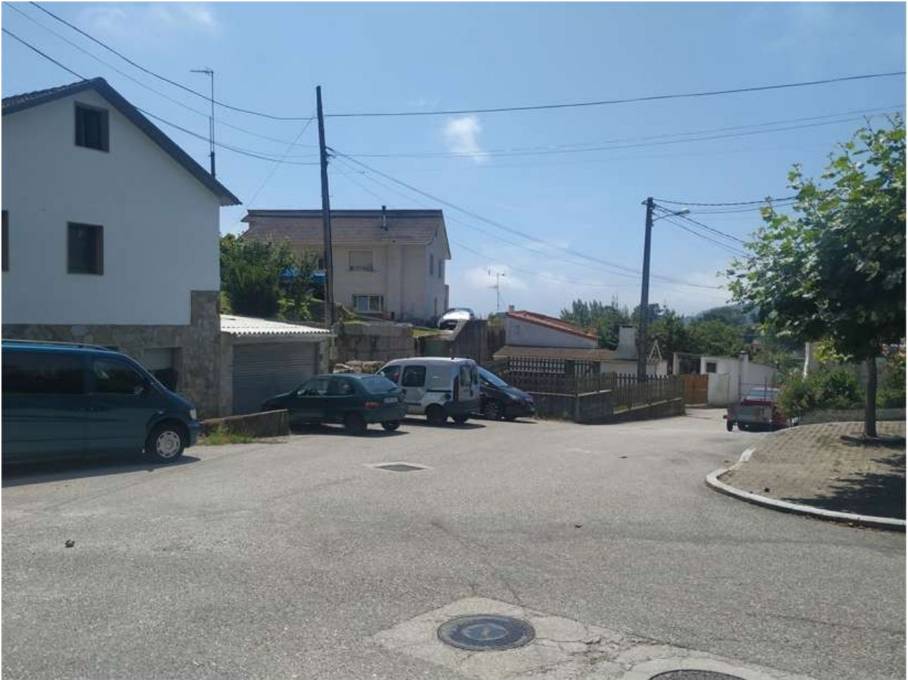
Praza do Largo de Sancho