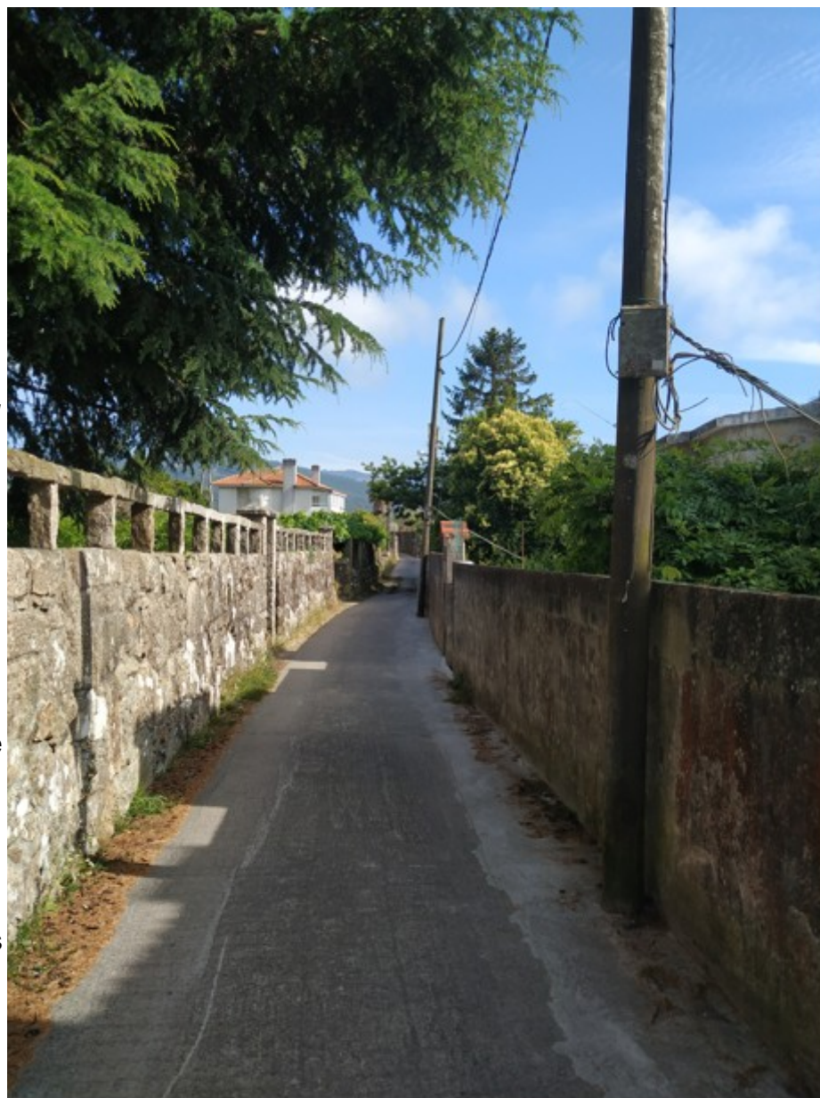
Avenida da Romana

Río Muíños: Este río nace en la zona del