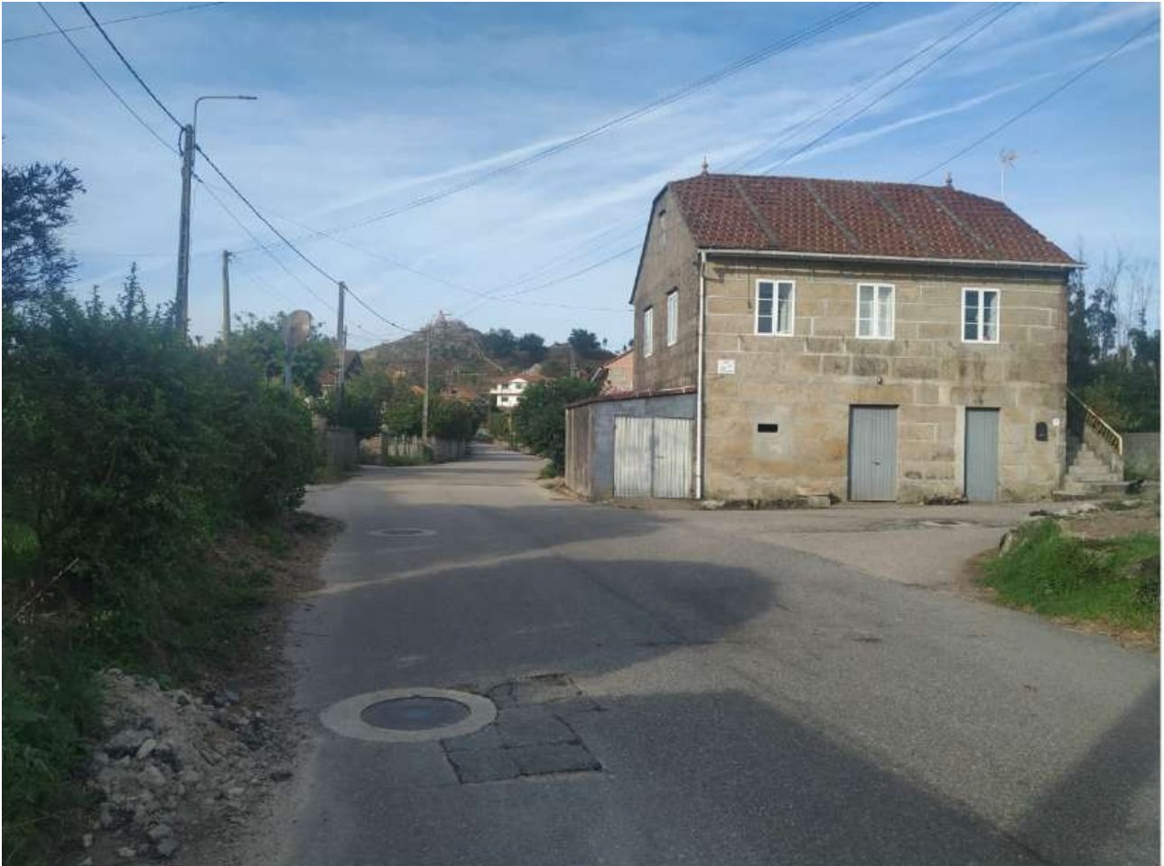
Cruce de la Rúa das Laxes con la Rúa das Tomadas

Referido a unas piedras lisas y llanas, en ocasiones estas piedras pueden ser de gran tamaño.