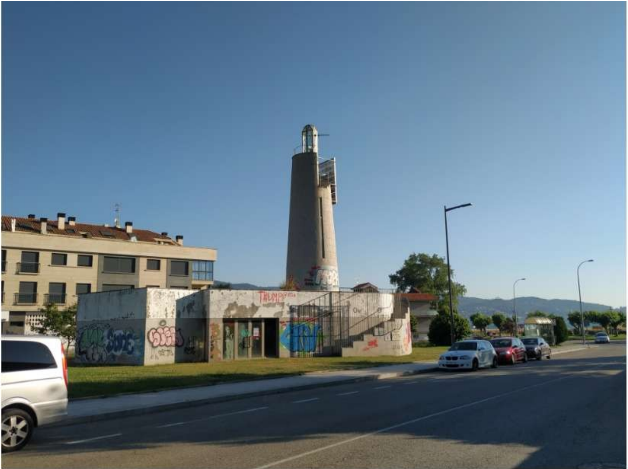
Faro existente en Panxón, y que da nombre a una calle