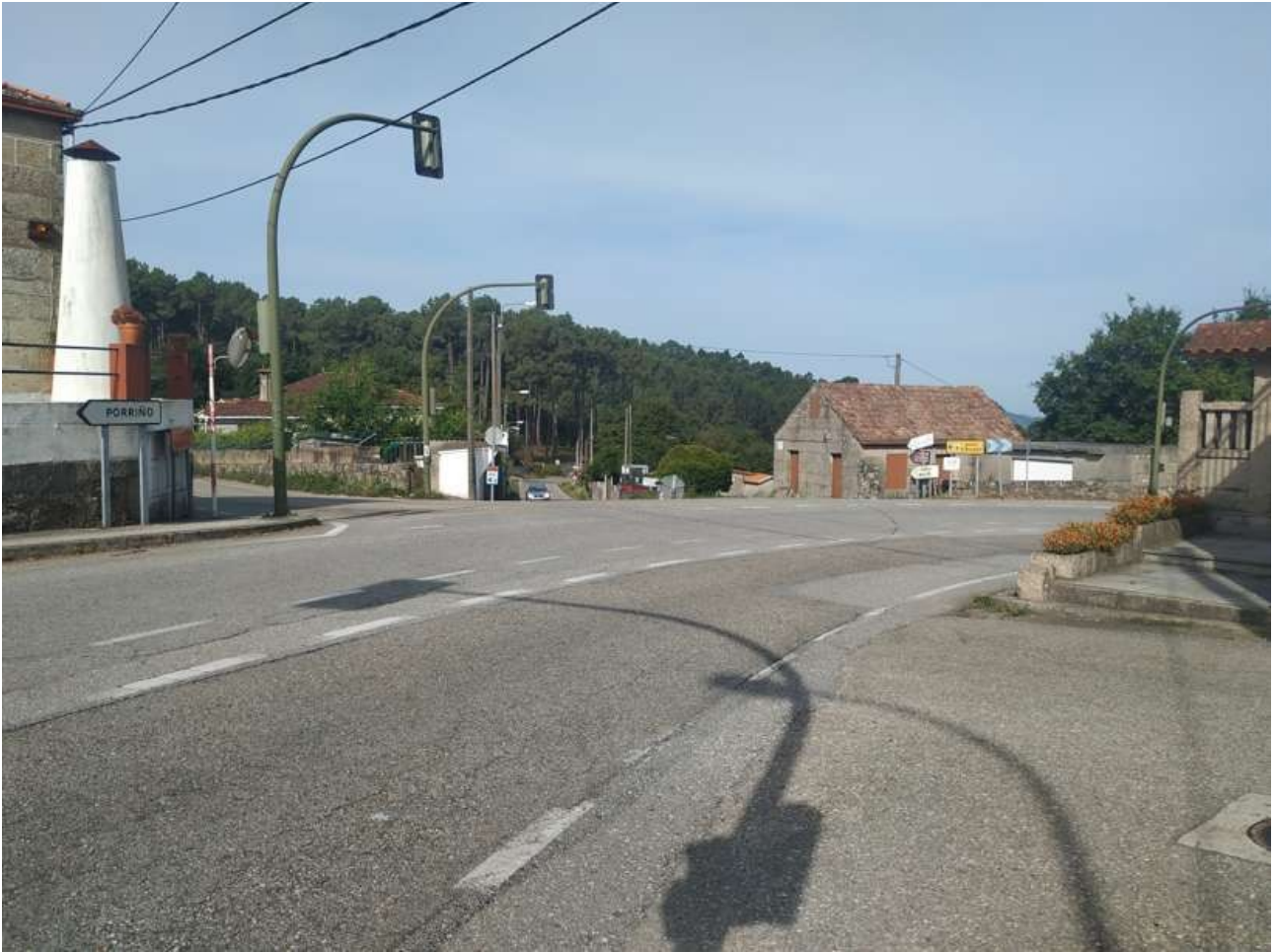
Cruce de la Rúa de Santiago de Parada con la Rúa do Monte Castelo, en el cruce que marca el límite entre Parada y Vilaza, y por ende, entre Nigrán y Gondomar