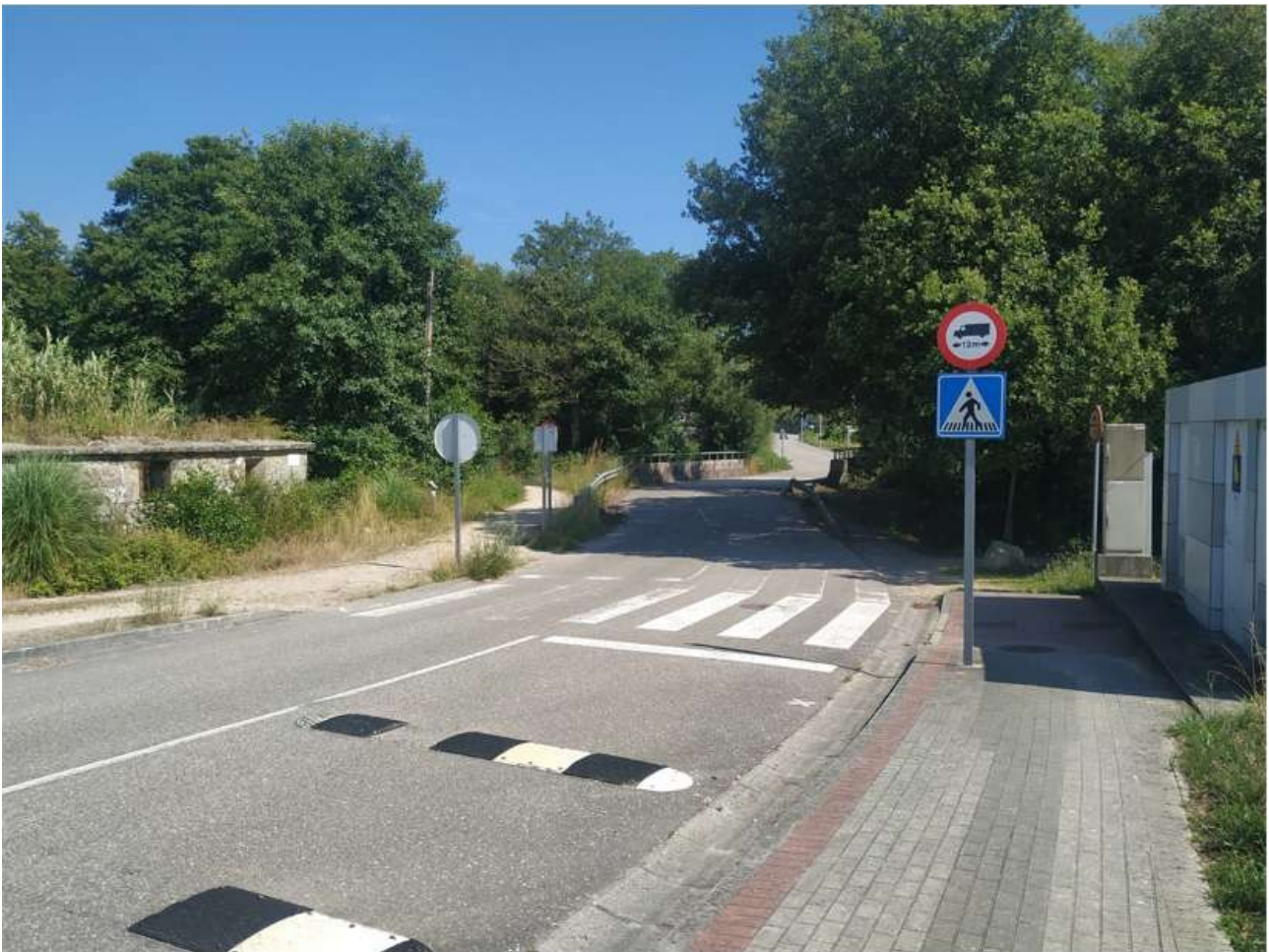
Rúa do Porto do Molle

Haría referencia a un porto , un cierre colocado para impedir el paso del ganado y permitir el paso de las personas, aunque también puede hacer referencia a un obstáculo natural. La segunda parte del topónimo es bastante más oscura, se puede entender como mole o molle , parte blanda de algo, hecho que puede dar lugar a un topónimo, pero no está nada claro y poco hay que decir mientras no aparezcan más datos que den más luz.