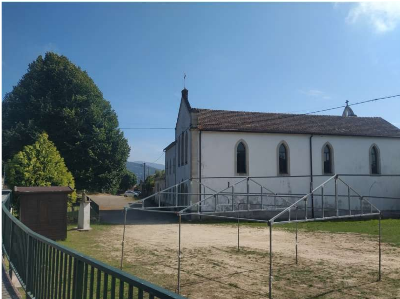
Convento de los Padres Franciscanos

Su figura siempre ha sido honrada por el socialismo español, y tras la muerte de Franco, muchos municipios le han dedicado calles, y cuando escribo estas líneas, el partido que fundó ostenta el poder en España. 37