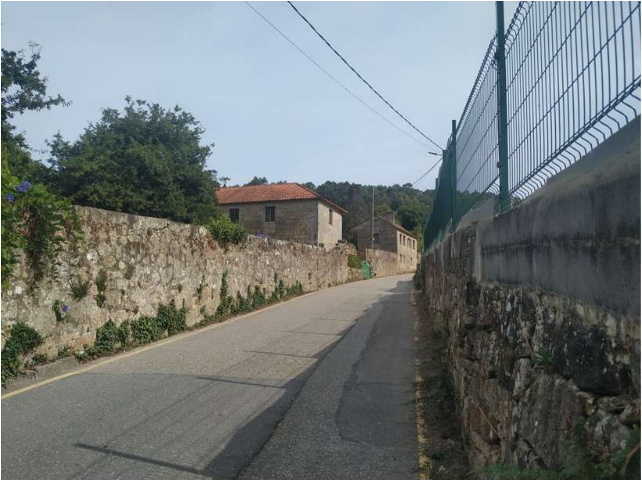
Pazo de Cea